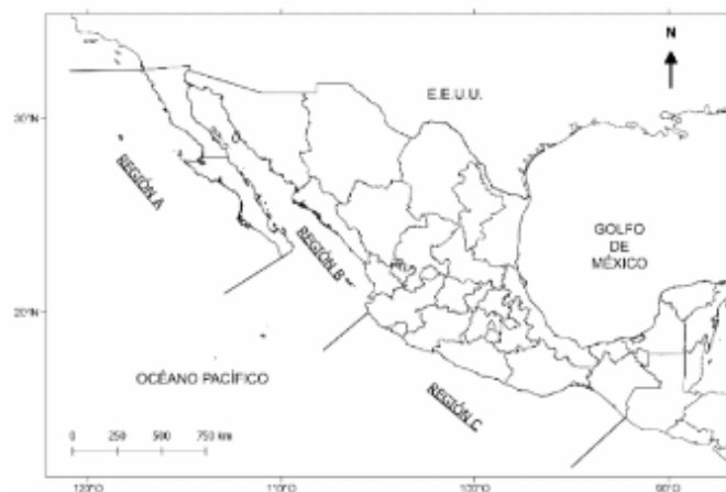
Fig. 1. Regiones geográficas de operación de la flota sardinera en el litoral del Océano Pacífico, incluyendo el Golfo de California.

Región C: Zona marina delimitada por el paralelo de 20°00' Latitud Norte y los límites con la República de Guatemala. Comprende del norte de Jalisco hasta Chiapas.