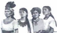
DRA. ALICIA VIRGINIA POOT SALAZAR

ATENTAMENTE: LA DIRECTORA GENERAL DE ORDENAMIENTO PESQUERO Y ACUÍCOLA Y COORDINADORA GENERAL DEL SUBCOMITÉ DE PESCA RESPONSABLE DEL CCNNA-AGRICULTURA