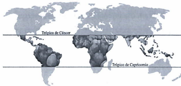
Figura 1. Cinturón Cafetero o Zona Cafetera.

Fuente: Organización de las Naciones Unidas para la Alimentación y la Agricultura.